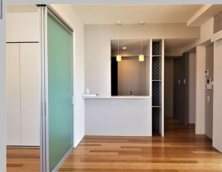
※同タイプのお部屋です。内装は変更されている場合があります。