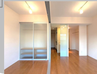
同タイプのお部屋です